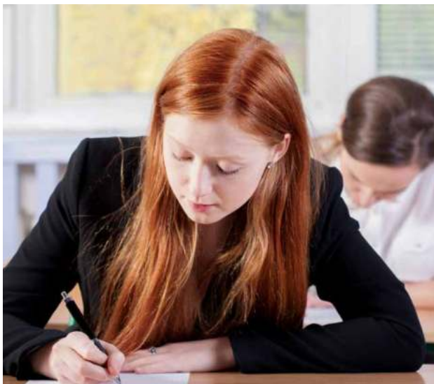
Prima probă scrisă va avea loc în 20 iunie 2022

Pentru disciplina de Limba și Literatura Română, elevul va trebui să facă dovada competențelor dobândite în ciclul inferior și în cel superior de liceu (clasele a IX-a - a XII-a), corelate cu anumite conținuturi parcurse în cele două cicluri liceale, din care amintim: utilizarea adecvată a strategiilor și a regulilor de exprimare orală în monolog și în dialog, în vederea realizării unei comunicări corecte, eficiente și personalizate, adaptate unor situații de comunicare diverse; utilizarea adecvată a tehnicilor de redactare și a formelor exprimării scrise compatibile cu situația de comunicare în elaborarea unor texte diverse; identificarea particularităților și a funcțiilor stilistice ale limbii în receptarea diferitelor tipuri de mesaje/texte; compararea unor viziuni despre lume, despre condiția umană sau despre artă reflectate în texte literare, nonliterare sau în alte arte, argumentarea unui punct de vedere față de o problemă pusă în discuție, și altele menționate în Anexa nr. 2 la Ordinul Ministrului Educației nr. 3237/5 februarie 2021 privind aprobarea programelor