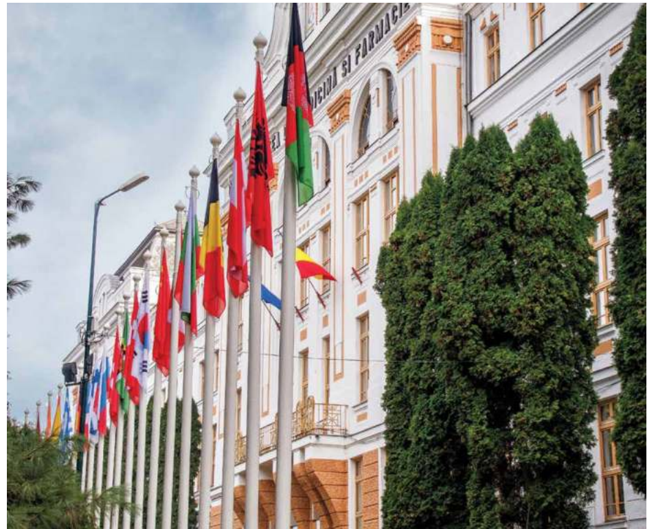
UMFST Târgu Mureș, o universitate de top în peisajul academic românesc