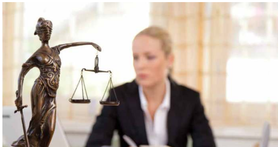
Prima etapă are loc în perioada 15 martie - 15 iunie 2022

În cadrul programului, educația juridică se va realiza prin activități ca: expuneri în cadrul unităților școlare pe teme de educație juridică în modalitate non-formală, de către avocații selectați de Barou, organizarea unor evenimente pentru elevi, precum concursuri pe teme juridice, procese simulate, cluburi de dezbateri juridice, sondaje etc.; vizite ale