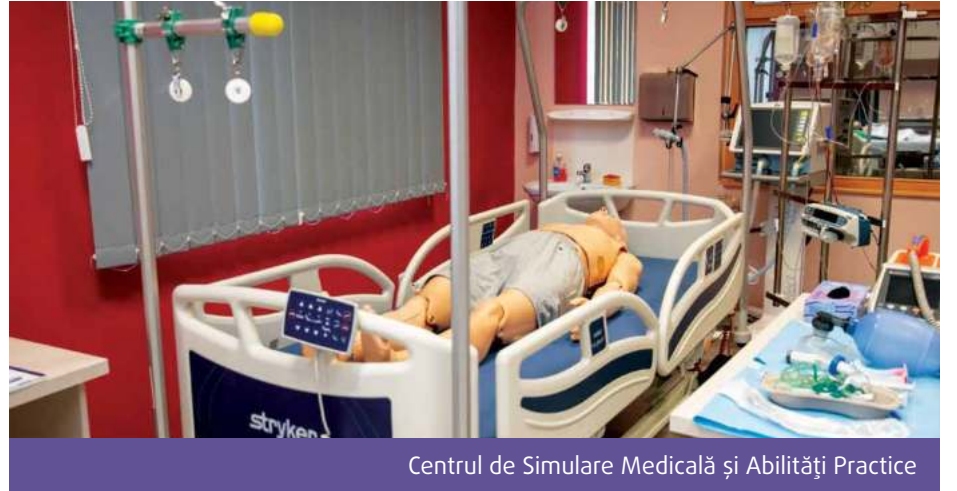
Centrul de Simulare Medicală și Abilități Practice