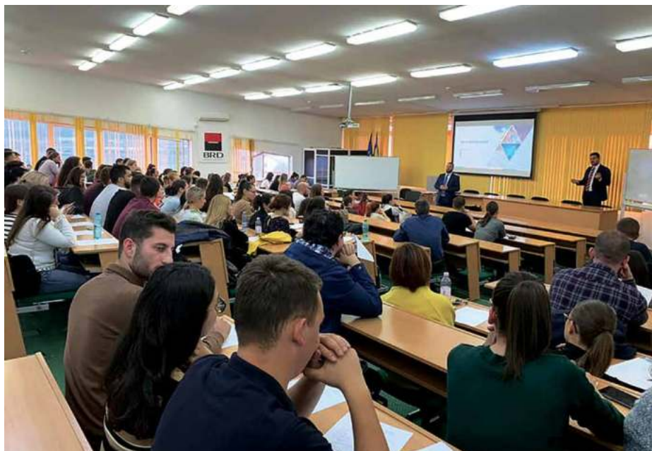
Studenți antrenați într-un proces educațional modern

Învățământul de licență este organizat și la forma Învățământ la distanță, Facultatea asigurând, prin intermediul Centrului I.F.R.D., pregătirea studenților la specializările