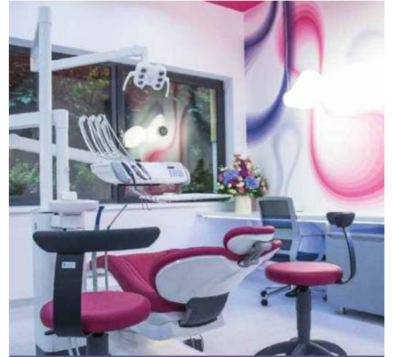
Laboratorul DENT ESTET, structurat inteligent, adaptat nevoilor studenților