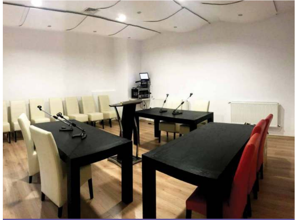
Laborator procese aplicate