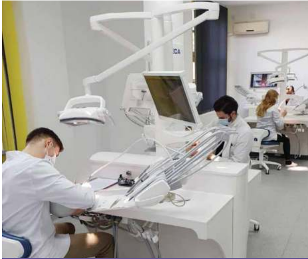
Studentii își dezvoltă abilitățile practice în Centrul de simulare