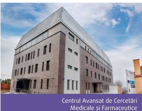
Centrul Avansat de Cercetări Medicale și Farmaceutice

„Facultatea de Medicină reprezintă componenta principală a Universității noastre, atât prin prisma numărului de studenți și de cadre didactice, cât și din perspectiva realizărilor profesionale medicale, de cercetare și de dezvoltare academică. A fost înființată acum aproape opt decenii și a devenit simbolul vieții academice mureșene.