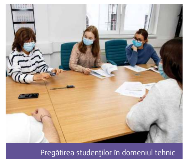
Pregătirea studenților în domeniul tehnic