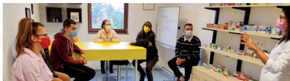
Spațiu destinat simulării activității dintr-o farmacie

ofertă generoasă de studii de master: Calitatea medicamentului, alimentului și mediului; Cosmetologie și dermofarmacie; Biotehnologie medicală