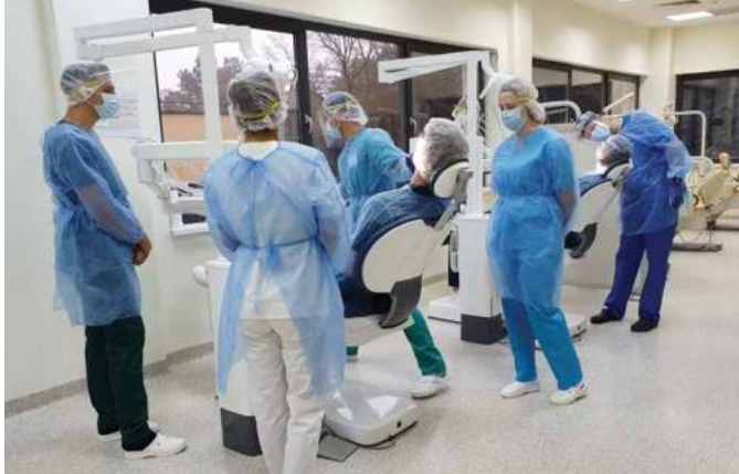
Studentii la stagiul clinic