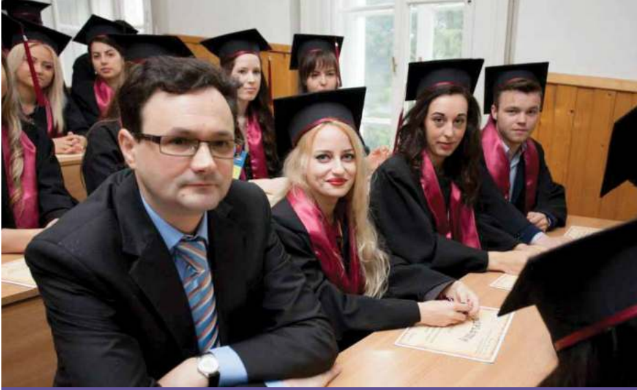
Absolvenți ai Facultății de Economie și Drept