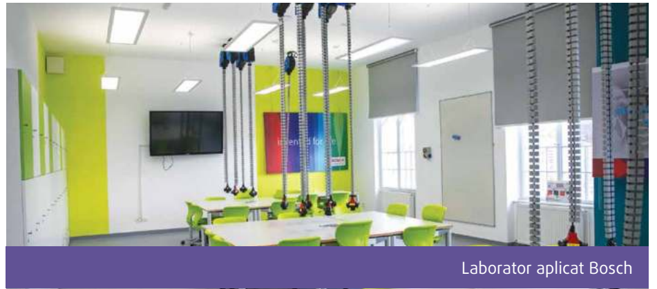
Laborator aplicat Bosch