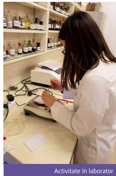
Activitate în laborator