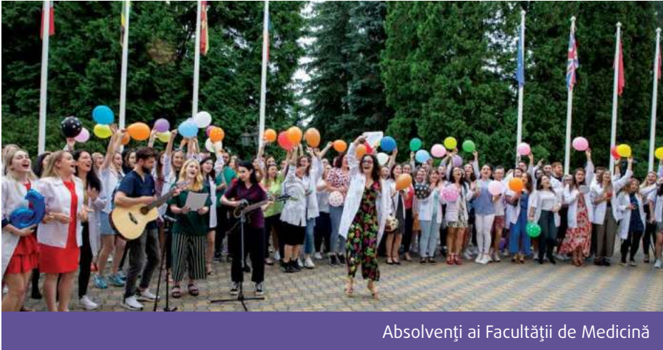
Absolvenți ai Facultății de Medicină