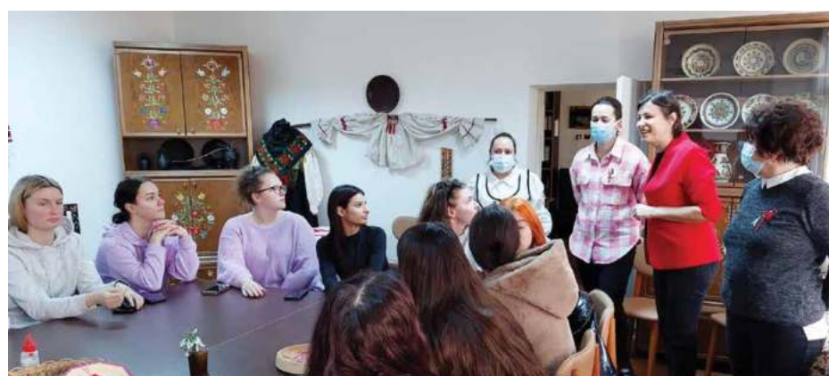
Atelierul a fost găzduit de Muzeul Etnografic „Anton Badea”