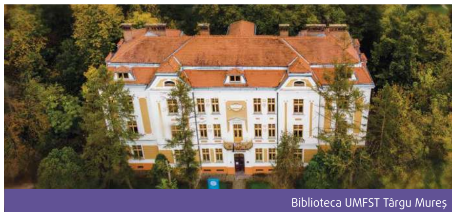
Biblioteca UMFST Târgu Mureș

Detaliile referitoare la admiterea pentru anul