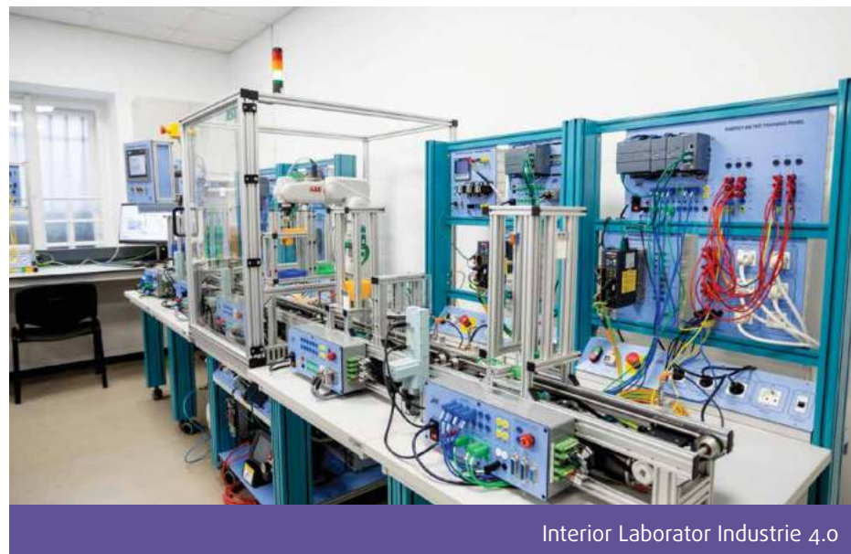
Interior Laborator Industrie 4.0

Facultatea de Inginerie și Tehnologia Informației