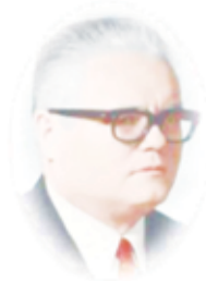
LICEUL TEHNOLOGIC „VASILE NETEA” DEDA, JUD. MUREȘ